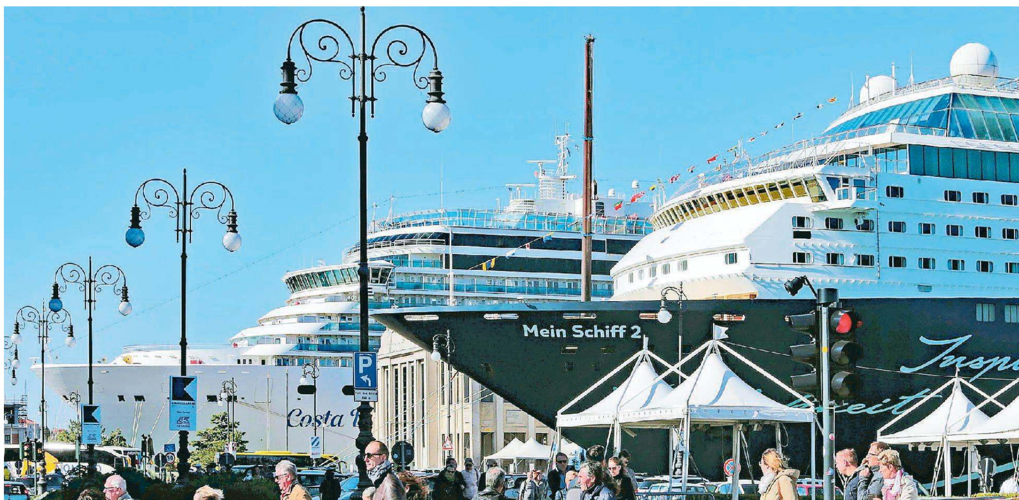
Ormezzate a fianco della Marittima le navi da crociera "Costa Deliziosa" e "Mein Schiff 2" dominano con la loro mole le Rive.