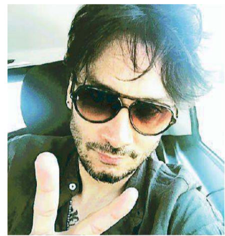
Nel riquadro Fabrizio Moro, nella foto grande il palco del Festival Show stasera di nuovo a Bibione