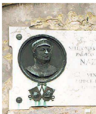
La lapide in campo Sauro

Cento porti, da Sanremo a Trieste, per portare un messaggio di solidarietà, giustizia e libertà. Con una barca a vela e un libro: "Nazario Sauro, storia di un marinaio". Arriva anche a Venezia l'ambizioso progetto dell'ammiraglio Romano Sauro, nipote dell'eroe della prima guerra mondiale, che presenta il volume domenica 12 agosto presso il Tennis Club Venezia di Lungomare Marco 61, alle ore 18 con ingresso libero. La barca a vela di nove